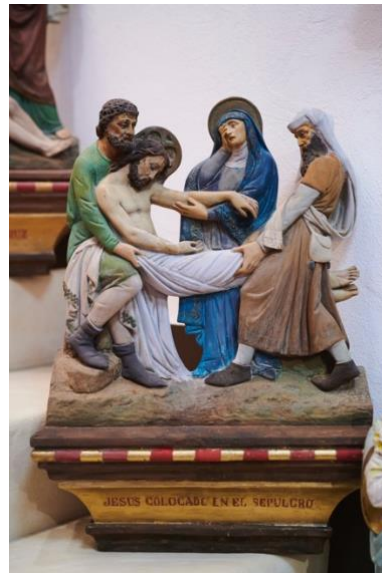
13. Jesus wird vom Kreuz abgenommen 14. Jesus wird ins Grab gelegt